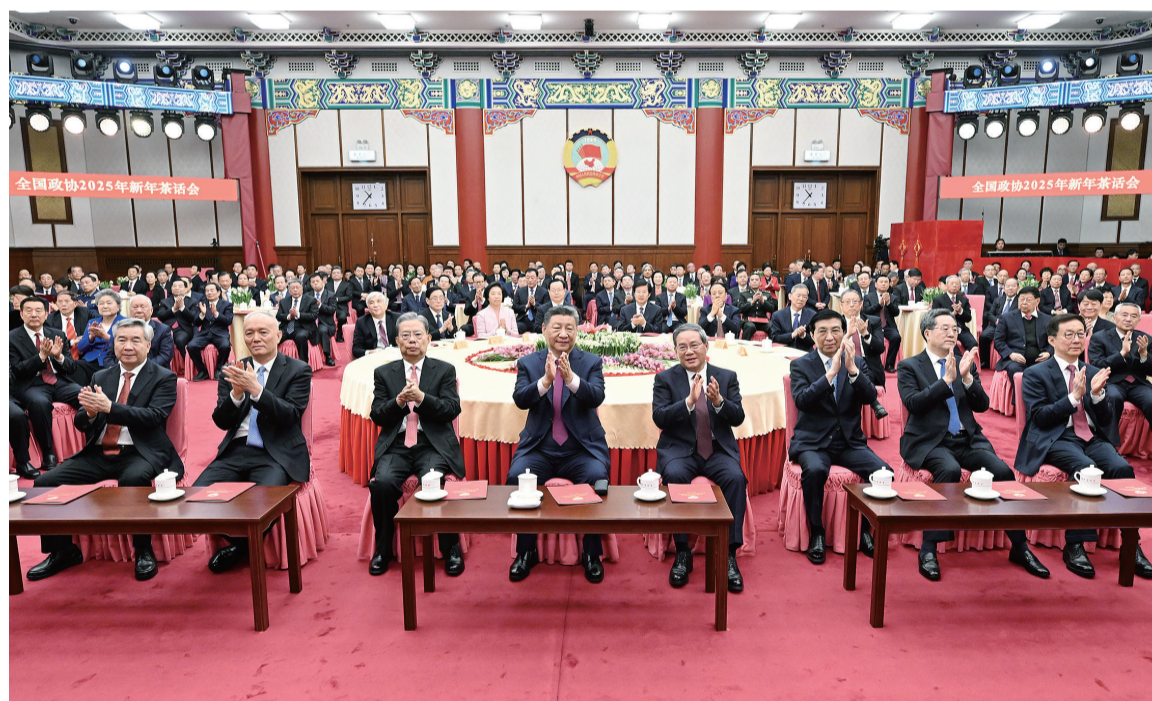
2024年12月31日，全国政协在北京举行新年茶话会。党和国家领导人习近平、李强、赵乐际、王沪宁、蔡奇、丁薛祥、李希、韩正出席茶话会并观看演出。

茶话会由中共中央政治局常委、全国政协主席王沪宁主持。他指出，要认真学习贯彻习近平总书记重要讲话精神，毫不动摇坚持中国共产党的全面领导，牢牢把握人民政协性质定位，坚持围绕中心、服务大局，以改革创新精神推进履职能力建设，坚定信心、团结奋进，为全面完成2025年我国经济社会发展目标任务广泛凝心聚力，为以中国式现代化全面推进强国建设、民族复兴伟业而不懈奋斗。 民建中央主席郝明金代表各民主党派中央、全国工商联和无党派人士讲话，表示将更加紧密地团结在以习近平总书记为核心的中共中央周围，同心同德、团结奋斗，坚定不移朝着强国建设、民族复兴的宏伟目标奋勇前进。 茶话会上，习近平等来到各界人士中间，同大家亲切握手，互致问候。全国政协委员和文艺工作者表演了精彩的节目。最后，全场起立高唱《团结就是力量》。会场内洋溢着欢乐祥和的节日气氛。 在京中共中央政治局委员、中央书记处书记，全国人大常委会、国务院部分领导同志，全国政协领导同志和曾任全国政协副主席的在京老同志出席茶话会。