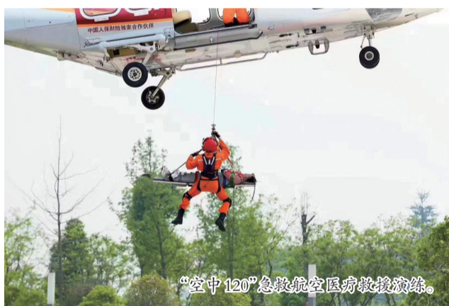
“空中120”急救航空医疗救援演练。

发展低空经济,国家层面的顶层设计,早见端倪。2021年2月,低空经济首次被写入《国家综合立体交通网规划纲要》;2023年12月,中央经济工作会议将低空经济提升至战略性新兴产业的高度;2024年1月1日,《无人驾驶航空器飞行管理暂行条例》正式施行;2024年3月全国两会期