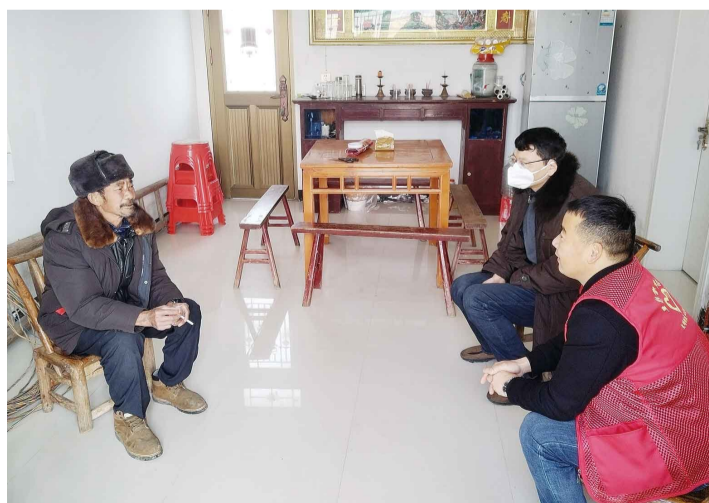
前往誓节镇监测户家中了解情况(资料图片)。