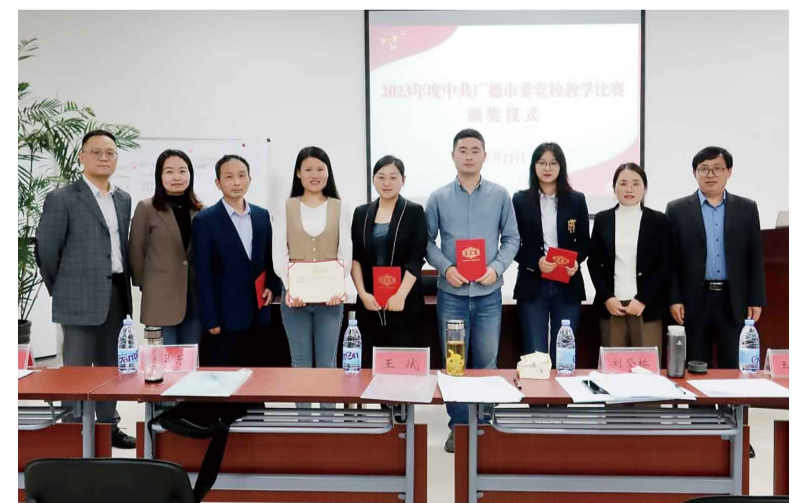
举办2023年度中青年教师教学比赛。