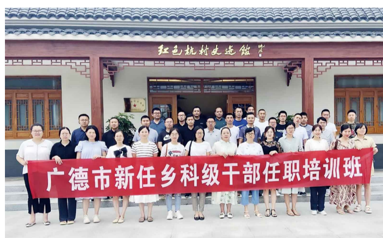
广德市新任乡科级干部任职培训班学员开展党性锻炼活动。

近年来，中共广德市委党校认真贯彻习近平总书记关于党校办学治校系列重要指示批示精神和党的二十大精神，紧紧围绕“坚定政治方向、全面创新发展、建设特色党校”的目标，谋新篇、开新局、建新功。