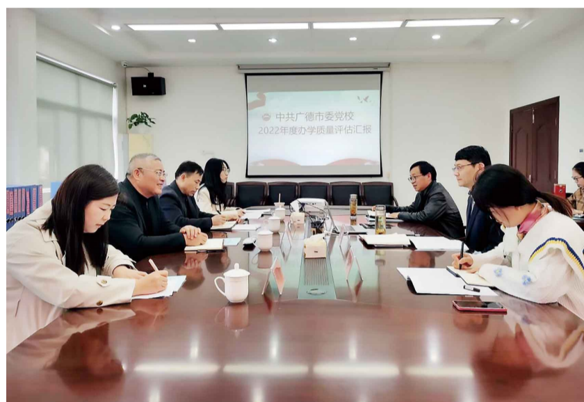
宣城市党校系统办学质量评估组来广德市委党校开展办学质量实地考评。

定位清，则方向明。 一直以来，广德市委党校始终遵循“党校姓党”根本原则，牢记新时代党校的职责定位，强化党建引领，把旗帜鲜明讲政治融入工作全过程和各方面，推进政治机关、政治学校建设，为全局工作坚定主旨、明晰方向，增强了全体党校人“在党爱党、在党言党、在党忧党、在党为党”的使命感和责任感。 真抓实干出成绩，首先要压实班子队伍的责任。为实现党建与业务双轮驱动、双向赋能，广德市委党校坚持主要负责人履行一岗双职的责任，并要求每位班子成员领办一个创新项目，实行目标责任制，进一步传导压力、激发动力。在各项重点工作中，班子成员做到率先垂范、冲锋在前，层层立标杆、人人做示范，呈现头雁领航、群雁齐飞的良好局面。