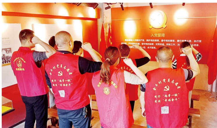
金牛村党组织开展“政治生日”活动。

例如，根据当下金桥村经济发展现状，把品牌创建与金桥村产业创新深度融合；把握钟桥社区治理核心，创建“红心筑桥”党建品牌，将服务群众作为钟桥社区品牌内涵的主要内容；实施金牛村品牌提升行动，让“火红金牛”与美丽乡村紧密结合。截至今年6月，随着钟新村“新”服务”、钟西村“西”引力”、钟北村“红领钟北”党建品牌的正式推出，“一村（社区）一特色”创建工作全部圆满完成，全域形成了“一根主线穿，竞相绽放异彩”的生动画卷。