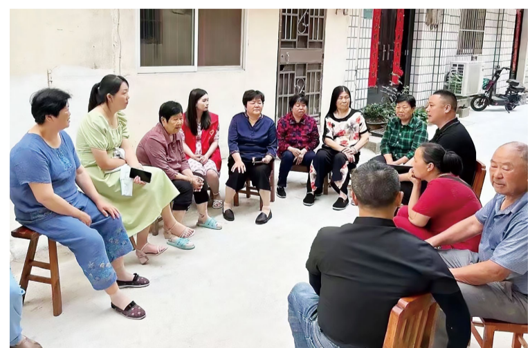
钟桥社区网格员、网格长收集群众意见。

今年以来，钟桥街道积极实践新时代“枫桥经验”，不断推进基层治理“走深、走实、走心”，一步步为党建发展注入新活力。