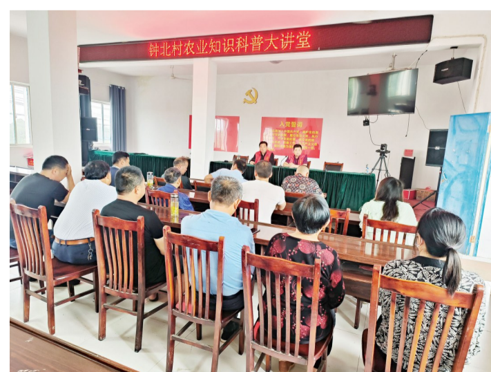
钟北村农业知识科普大讲堂。