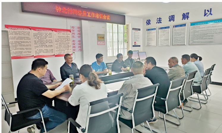
钟北村召开网格员工作推进会。

乡风文明评议工作是党建引领信用村建设工作的基础和重要环节。去年，钟桥街道选取金牛村作为试点村，动员各方参与乡风文明评议工作，深入开展党建引领信用村建设工作，着力构建基层党组织乡村治理新格局。