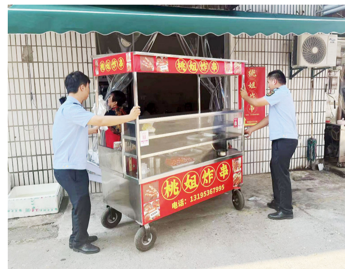
街道开展钟桥集镇市场整治行动。

例如，钟北村党组织开办农民夜校，开展西瓜种植、龙虾水质治理等多技能培训，目前共组织林木病虫害防治讲座16场，用技能“小培训”帮助村民实现增收致富，解决了当地群众的就业问题；同时坚持下好产业发展“一盘棋”，通过发包、租赁、参股、合作等方式对村集体土地、水塘、闲置房屋进行资源盘活，目前村集体经济收入达50万元，并呈逐年上升趋势发展；发挥紧靠开发区独特地理位置，创新“村企共建、为企业服务、以企带村”发展模式，不仅为当地村民带来了新生活，更激活了乡村振兴“一池春水”。