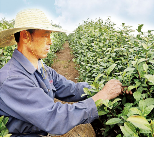
时下正是春茶采摘、制作的忙碌时节,郎溪县梅渚镇茶农和茶场抓紧采摘茶叶嫩芽、加工新茶,供应市场。 图为该镇凤凰山白茶种植家庭农场的生态茶园里,茶农们忙着采摘春茶。