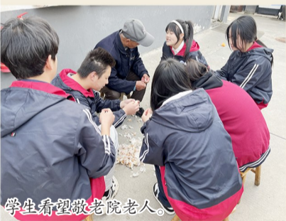
学生看望敬老院老人。