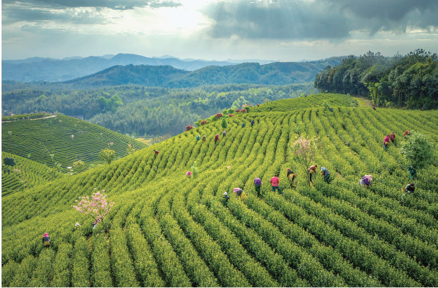
3月21日,广德市柏垫镇刘福桥村凤凰山茶园满目翠色、茶香飘逸,早春茶陆续进入采摘期。近年来,柏垫镇大力实施以旅兴茶,以茶促旅。目前,该镇共有茶园8070亩,覆盖14个村,带动165户5000余人就业。彭莘梓 储邱霞 摄