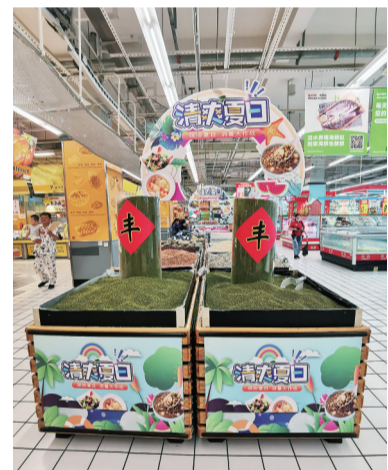
市区某超市“清凉食材”热销。

导购员介绍，从5月份开始，店内具有防晒和保湿功能的产品开始热卖，80%的顾客都是来买防晒霜、防晒喷雾的。