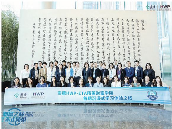
2021年9月14-17日,泰康人寿HWP-ETA(泰康精英财富管理研修班)嘉年华。

数据显示,截至2022年6月,泰康人寿健康财富规划师(HWP)人力已突破万人平台。