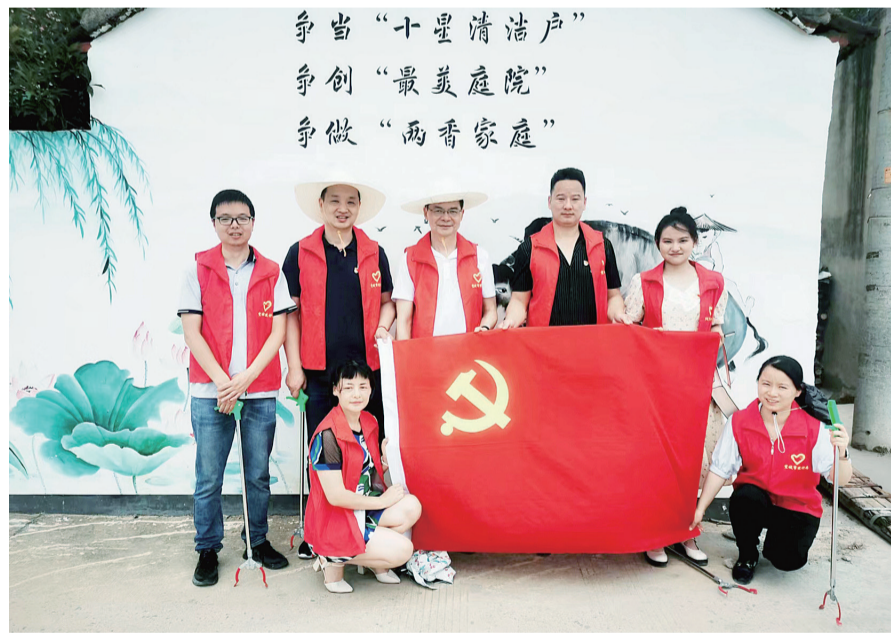
▲日前,安徽成厚建筑工程有限公司党支部组织20余名党员职工,来到泾县新四军军部旧址开展党建活动。图为党员职工们重温入党誓词。