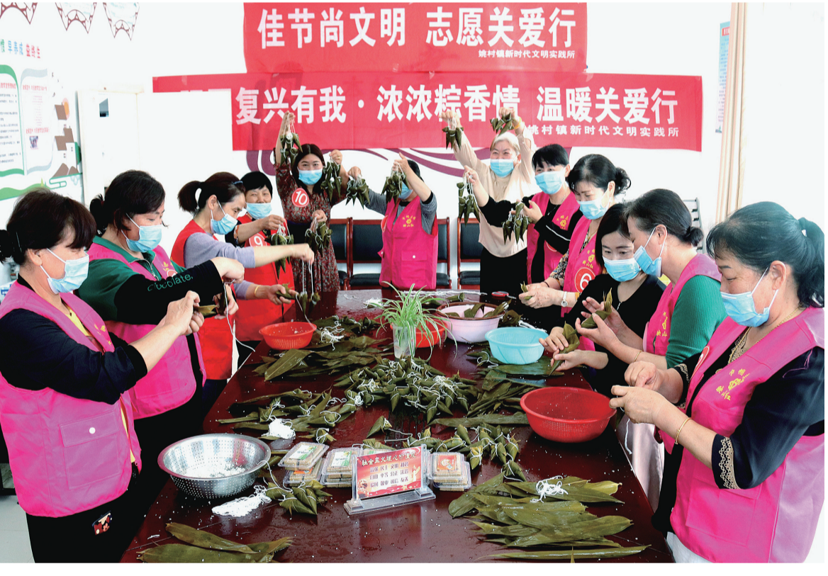
一年一度的传统节日“端午节”临近,5月26日,郎溪县姚村镇开展了“我们的节日”——比赛包爱心粽子敬老留守老人活动,表达了尊老爱老敬老之情。