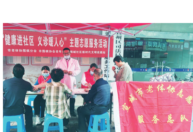
5月28日上午,市老体协围棋分会、市中心医院在宣州区锦城社区新时代文明实践站开展义诊活动。活动中,志愿者们为居民提供面对面、零距离的义诊服务、健康咨询,对居民提出的问题耐心地解答并予以建议。

本报讯 日前,绩溪县市容市貌攻坚战“再下一城”,城区整条良安路23个店铺外水池全部拆除,同时占道堆放、出店经营、乱停乱放等问题进一步得到整治。从4月起,该县吹响了新一轮省级文明城市创建号角。作为创建主力军,绩溪县城管执法部门以市容秩序和环境卫生两大专项整治为抓手,认真谋划每一项活动,充分发挥网格作用,采取“精细管理,逐街整治”的形式对城区主要街道开展“地毯式”排查、“销号式”推进、