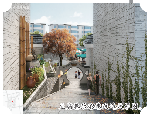
豆腐巷乐彩巷改造效果图。