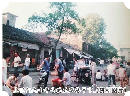
上世纪九十年代的豆腐巷早市。(资料图片)

她也是城市的“微血管”，记录着城市的发展和变迁。令人欣喜的是，这条小巷“旧貌”即将换“新颜”！