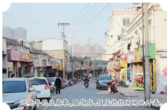
近年来的豆腐巷，服饰店、饭店热闹地开着。