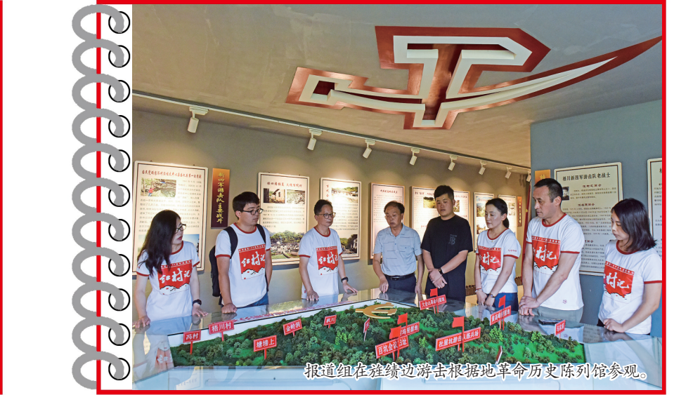
报道组在皖南边区根据地革命历史陈列馆参观