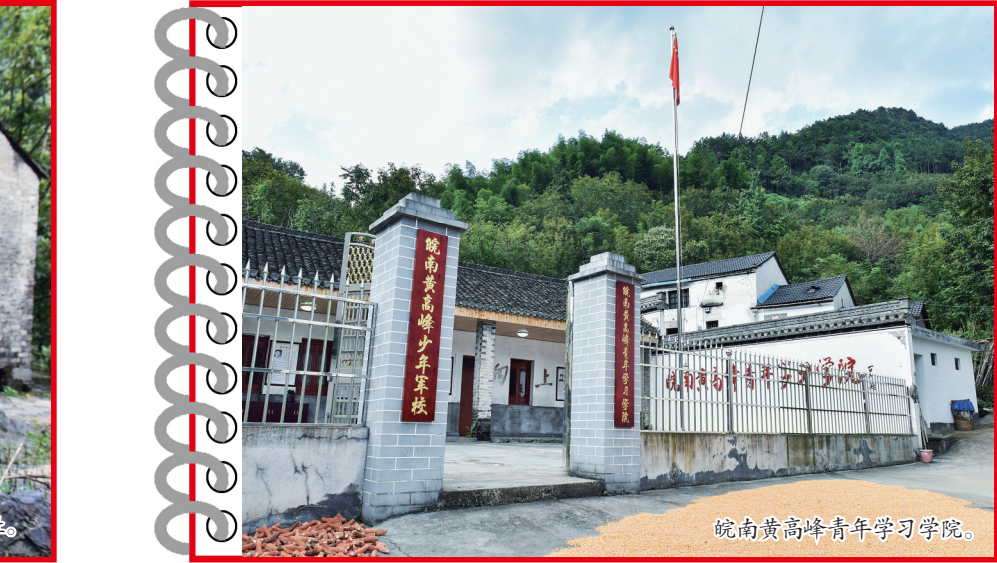
皖南黄高峰青年学习学院