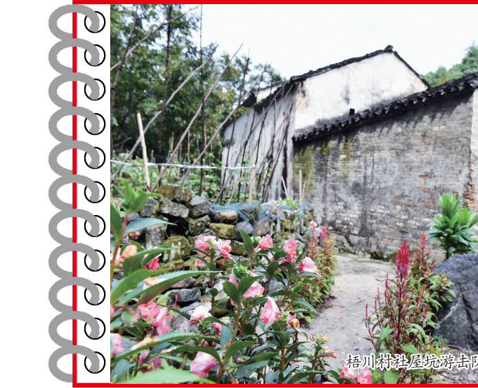
梧川第一小学为红色教育基地旧址