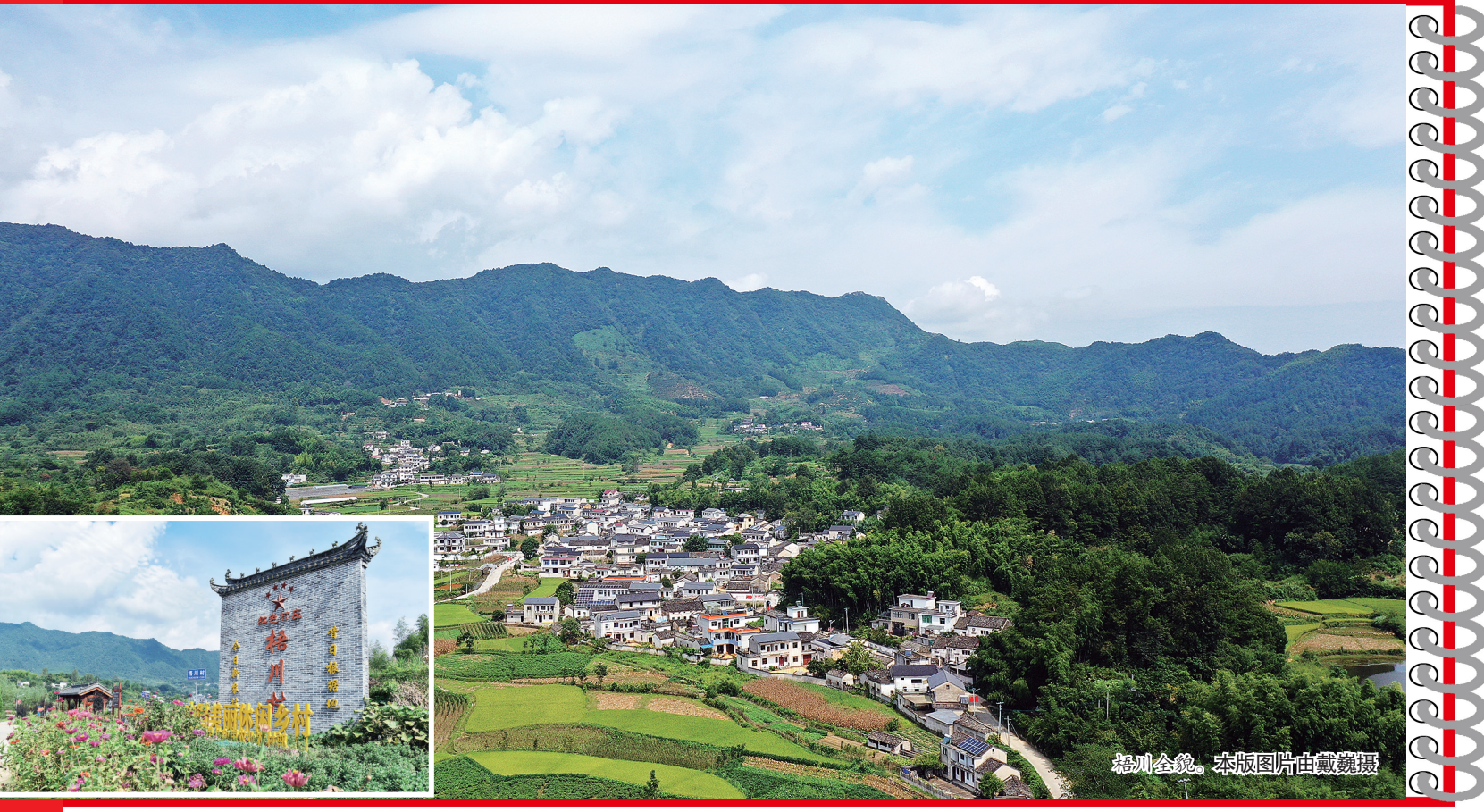
梧川风貌。

总监制：王建玲 总策划：倪欣生 李 茜 总撰稿：李 茜 本期报道组：顾维林 谭艺莹 徐静雅 戴 巍 版面统筹：芮玲玲 资料顾问：陈虎山 题 字：赵雪梅