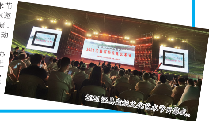
2021泾县宣纸文化艺术节开幕式。

弘扬传统文化,加快文旅融合,全力打造美丽经济先行区,先后荣获国家园林县城、中国首届文化百强县、2021全国县域旅游综合实力百强县等称号。该县始终把加快宣纸产业融合发展摆在突出重要的位置,大力推进宣纸小镇、宣纸书画纸市场等重点项目,精心组织开展了宣纸书画交易、研学交流等活动,不断推动产品创新、经营创新和业态创新,推动宣纸向文化旅游深度延伸,有力地促进了产业多元化发展。