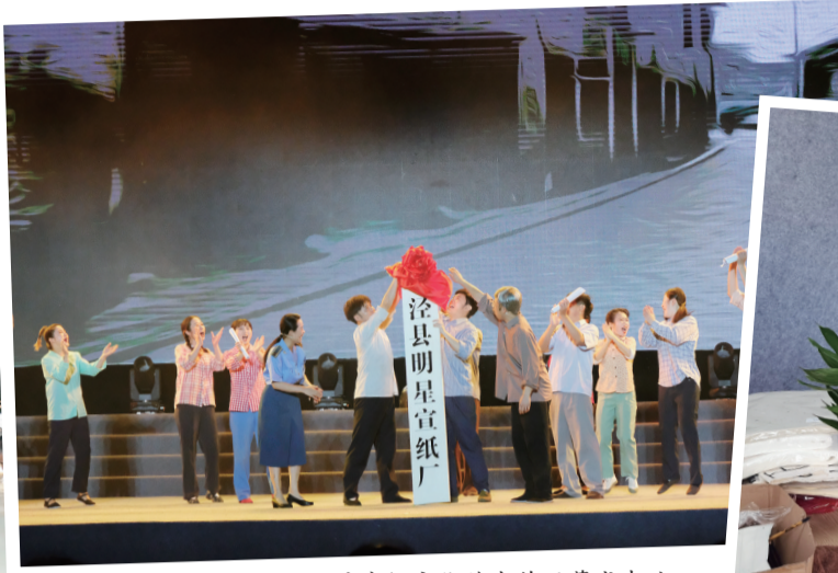
2021泾县宣纸文化艺术节开幕式表演。