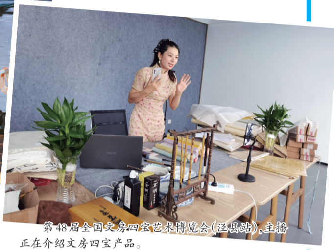
第48届全国文房四宝艺术博览会(泾县站),直播正在介绍文房四宝产品。

泾川佳境,山水如画迎盛事;纸寿千年,墨韵万变抒华章。9月27日晚,2021泾县宣纸文化艺术节盛大开幕。开幕式现场,12个精心准备的文艺节目,3个震撼人心的华丽篇章,以艺术化的表现形式,向观众演绎了宣纸文化的独特韵味。