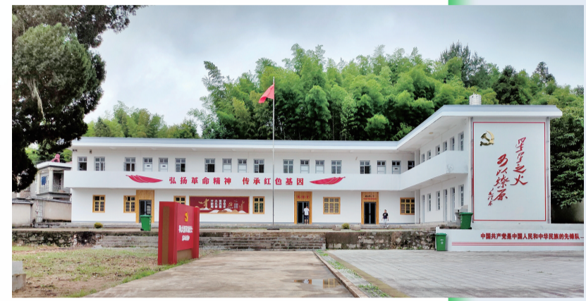
皖南第一个党支部纪念馆