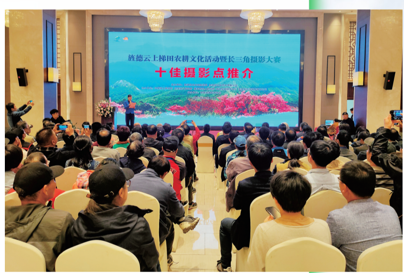
旌德云上梯田农耕文化摄影大赛十佳摄影点推介