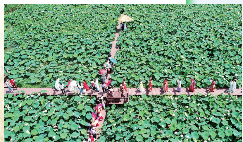
旌德荷花吸引八方游客