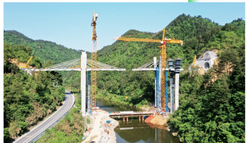
芜黄高速旌德段徽水河大桥建设