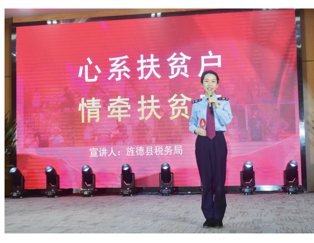
9月25日下午,全市“深入学习贯彻宣传贯彻习近平总书记考察安徽重要讲话精神 决战决胜脱贫攻坚”主题演讲比赛在宛陵科创城一号楼举行,全市15名选手同台演讲。

本报讯 为进一步做好根治拖欠农民工工资工作,深入贯彻落实《保障农民工工资支付条例》,近日,我市根据省人社厅统一安排部署,在全市范围内集中开展根治欠薪专项行动暨执法月活动,范围包括工程建设领域和劳动密集型加工制造业,并重点突出政府投资项目和国企建设项目,同时以政府投资项目、国有企业投资或承接的工程项目及有欠薪记录的其他在建工程项目为重点,通过明确分工、全面摸排、集中整治、督导检查等方式方法,全面排查化解拖欠农民工工资问题,维护农民工劳动报酬权益。 大力宣传广泛发动,我市按照“属地管理、分级负责、谁主管谁负责”原则,发动辖区内在建工程项目和用人单位对照《保障农民工工资支付条例》开展自 查自纠,安排专人负责,对工资支付情况进行内部排查梳理,建立问题台账,及时排除欠薪隐患。同时,按照“谁执法谁普法”原则,做好保障农民工工资支付相关法律法规、政策文件的宣传。 逐一排查集中整治,集中时间、集中力量对本辖区、本行业内各类在建工程项目农民工工资支付情况逐一逐项进行全面的排查梳理,严格落实“三查两清零”,实现欠薪隐患早发现、问题早处置、历史陈案早办结。 加强监管全程督导,进一步加强督促检查,各级根治拖欠农民工工资工作领导小组采取包保到人、实地调研和随机核查等方式,对专项行动全程督导,及时发现和督促问题整改。对监管责任不落实、组织不到位引发群体性事件或极端事件,以及政府投资项目拖欠工程款导致欠薪的,依法依规严肃追究责任。(本报记者 刘畅)