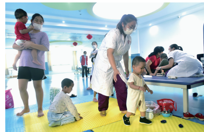
8月25日,是第四次全国残疾预防日。为增强全社会残疾预防意识和预防能力,倡导“残疾预防,从儿童早期干预做起”的理念,组织实施“护翼小天使”志愿服务项目,市、区残联共同开展第四次全国残疾预防日集中宣传教育活动。本报记者 戴巍 摄

问:为什么说垃圾分类可以促进资源循环与可持续发展? 答:宣城市区生活源的可回收物每年约有2万吨,一旦被餐厨垃圾、有害垃圾等污染后,回收利用价值就会急剧降低。随着垃圾分类,大量的玻璃、金属、塑料、纸质、织物类的包装、容器、产品等物质,就可以被回收循环再利用,有效地节约了各类资源,减少对矿产的开采和森林的砍伐,保障环境资源可持续发展,造福子孙后代。(未完待续)