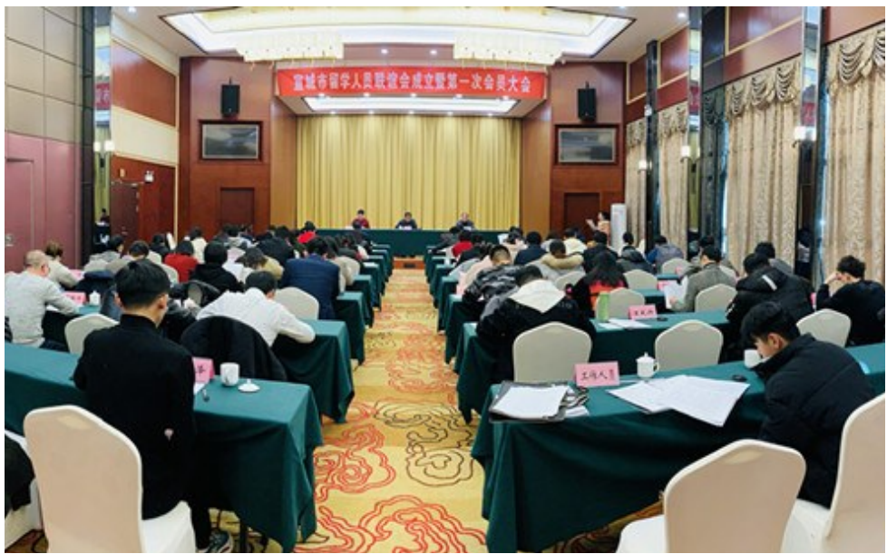
宣城市留学人员联谊会成立暨第一次会员代表大会。