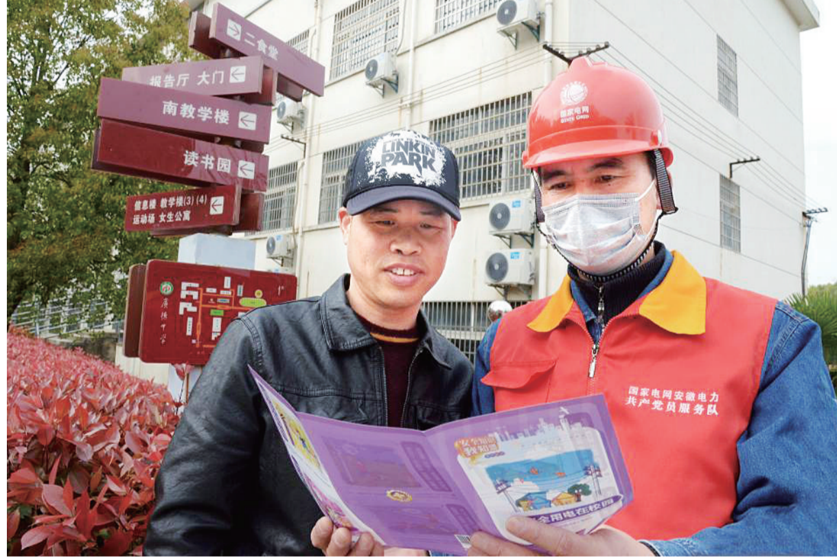
4月2日,国网广德市供电公司共产党员服务队深入广德中学、广德实验中学及广德三中等校,开展校园电力设施拉网式大体检,并向学校电力管理员讲解安全用电知识,提前为学生们送上“安全开学礼”。余小祥 朱镇涛 摄