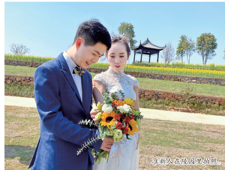
准新人在陵园里拍照。