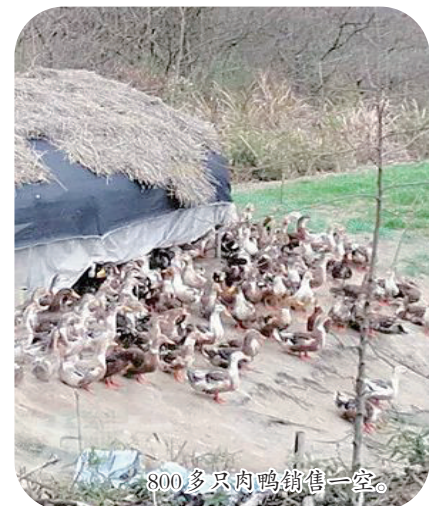
800多只肉鸭销售一空