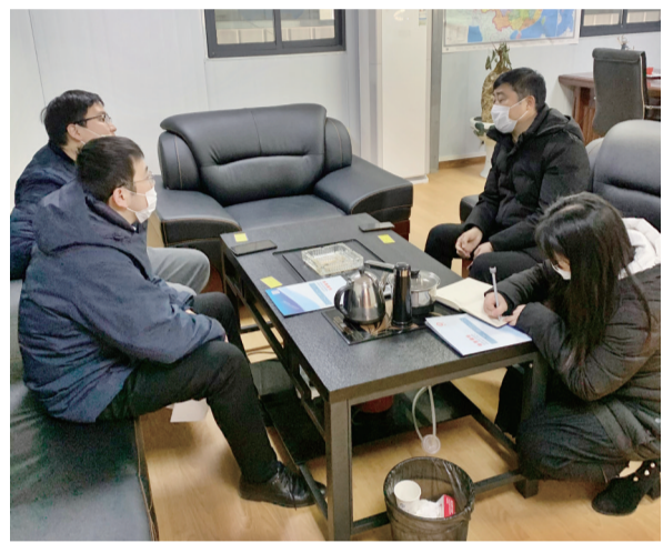
宣城分行客户经理走访市某公司，对接疫情影响下企业的复工及信贷需求情况。

为助力企业复工复产，该行积极摸排协调受困企业贷款延期。自疫情发生后，该行就考虑到受疫情影响的部分小微企业可能出现贷款到期还款困难问题。为此，该行提前对近期贷款到期情况进行了梳理。早在春节假期，该行工作人员就积极利用电话、微信等多种通讯方式与企业取得联系，逐户排查了解企业疫情期间受困情况，为还款有压力的企业办理贷款延期。截至目前，成功对全市28户小微企业共4544万元贷款做了延期处理。