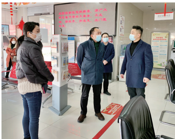
宣城分行党委走访慰问一线员工。

自新冠肺炎疫情发生以来，徽商银行宣城分行认真贯彻执行政府、监管部门和总行关于新冠肺炎疫情防控工作要求，把支持疫情防控、提供金融服务保障作为工作重中之重，以实际行动践行使命初心，献上一份金融机构的抗“疫”力量。