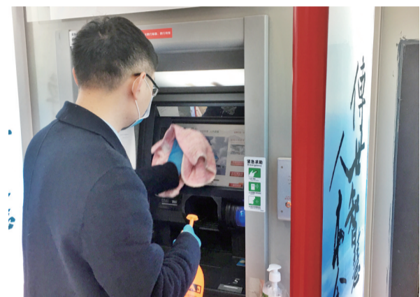
自助机具日常消毒。