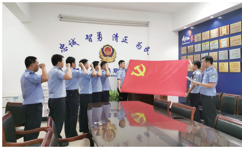
专注思想引领 铸造忠诚警魂

打造一支高素质公安队伍,要旗帜鲜明把政治建设放在首位。近年来,市公安局宣州分局坚持党建统领,狠抓理论武装、典型引领、文化育警和暖心惠警等工作,努力铸造忠诚警魂。