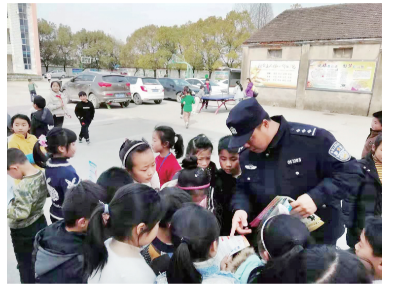
强化改革创新 提高警务效能

市公安局宣州分局坚持问题导向,不断深化警务运行机制改革,逐步建立适应动态化、信息化条件下的警务运行新机制,有效提升了警务工作效能。