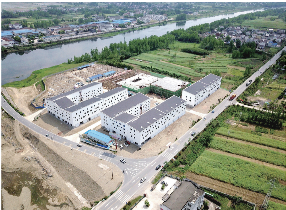
古法宣纸产业园暨泾县宣纸综合市场位于泾县丁家桥工业园,产业园总投资1.63亿元、占地30亩、总建筑面积3万多平方米。项目一期为综合市场,二期主要建酒店、综合大楼和其它配套设施,年底将全部完工并投入运营。目前已经有20家企业初步达成入驻意向。

张冬云强调,要进一步增强紧迫感,以时不我待、攻坚克难的决心,尽快完善治理方案,全面开展排查,坚持问题导向、靶向施策,制定精准工作“流程图”,加快城市黑臭水体治理工作步伐。要加强部门协作,强化统筹、严格督查,坚持治标和治本相结合,确保我市水环境治理各重点领域、各关键节点有新突破、新进展。要完善体制机制,加强调度指挥,专班专人推进黑臭水体治理等工作,突出治理重点,分清轻重缓急,科学确定先后顺序,精准实施治理措施,确保治理成效。要加大水环境综合治理工作宣传力度,动员全社会力量共同关注支持并积极投入生态宜居城市建设,形成广泛参与共治的良好氛围。(本报记者 何媛媛)