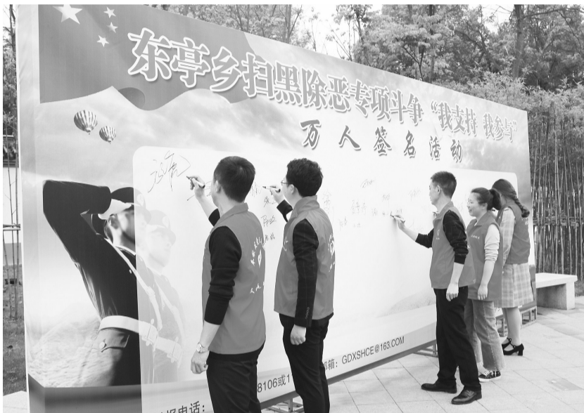
4月22日,广德县东亭乡团委联合多部门在党建公园举办东亭乡扫黑除恶专项斗争知识问答活动,提高群众对扫黑除恶专项斗争的参与度和知晓率。活动现场,该乡机关干部、周边群众纷纷在东亭乡扫黑除恶专项斗争“我支持 我参与”的签名墙上郑重地写下自己的名字。

寻衅滋事犯罪是涉黑涉恶犯罪经常涉及的罪名之一,本案的成功办理,充分体现了司法机关将打击犯罪与扫黑除恶专项斗争有机结合,提高了人民群众对扫黑除恶专项斗争的认知和了解,起到了强有力的震慑和警示效果。参加旁听的群众也纷纷表示,直击庭审现场让他们懂得了在日常生活中一定要依法严格规范自己的行为,不能意气用事,逞强斗狠,要善于运用法律武器维护自己的合法权益。该案将择期宣判。(张慧妹)